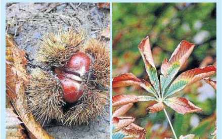
A la izquierda, «castañas fotografiadas en la sierra de Sevilla» por Aurora Jos Gallego. A la derecha, imagen titulada «el último suspiro de la hoja», de José Gascón.