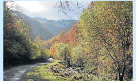
Susana Herreros manda una fotografía de un paisaje de otoño en Ezcaray (La Rioja).

OTOÑO Los lectores de 20 minutos siguen captando las distintas tonalidades de la naturaleza que ofrece esta estación del año. Animate tú también y envíanos tus fotografías otoñales.